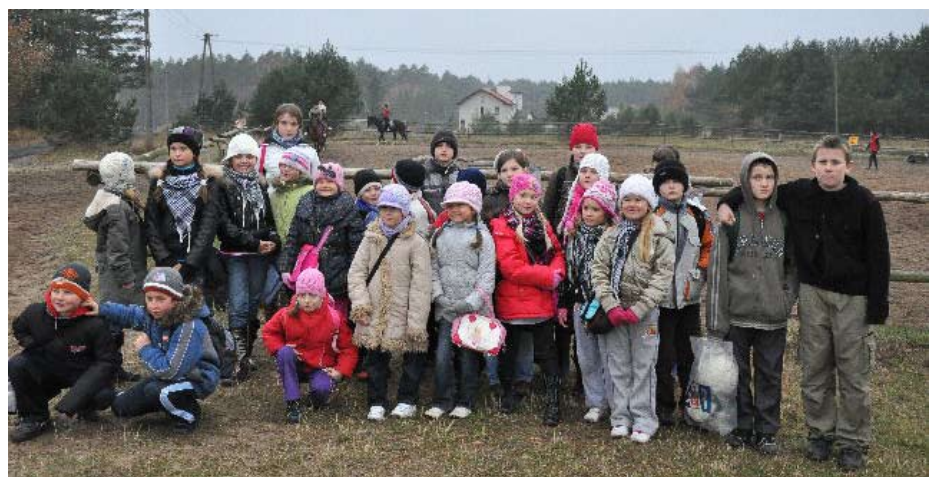
Uczestnicy wycieczki do stadniny koni.