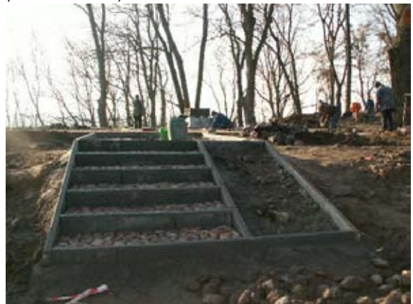
Prace na Wzgórzu Zamkowym.