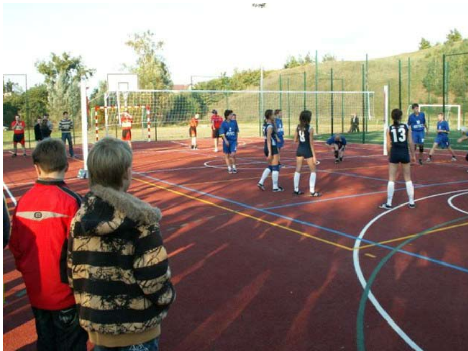
Orlika nie omijają również dziewczęta.