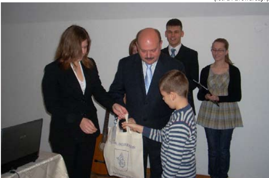
Wręczenie jednej z wielu nagród.