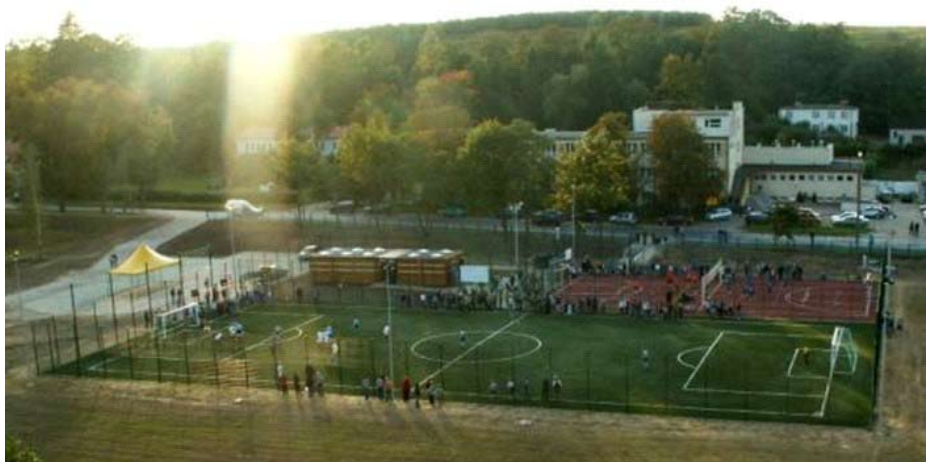
Nasz Orlik prawie z lotu ptaka.