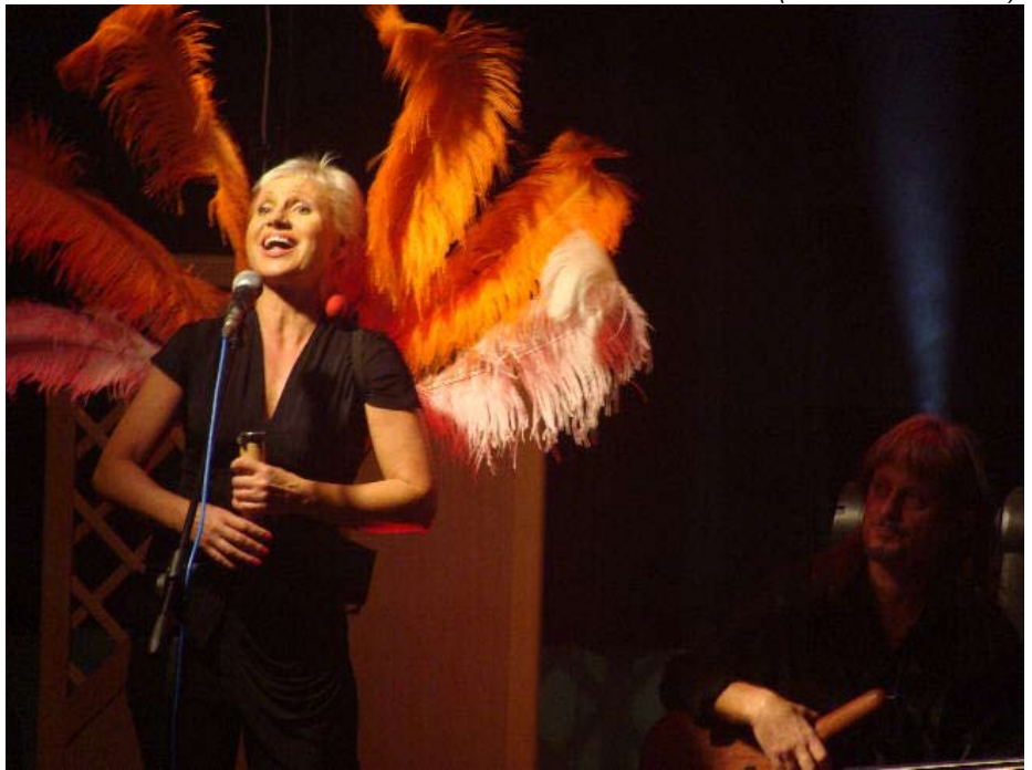
Czerwony Tulipan na scenie.