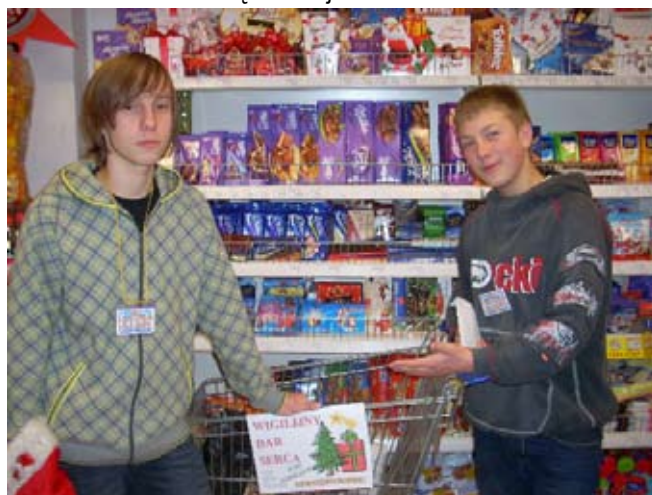
Członkowie Klubu Młodzieżowych Wolontariuszy.

PS Wolontariusze dziękują wszystkim mieszkańcom, którzy tak ofiarnie włączyli się do akcji.