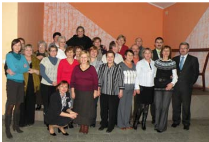
Uczestnicy projektu „45+” wraz z organizatorami – Myślice.