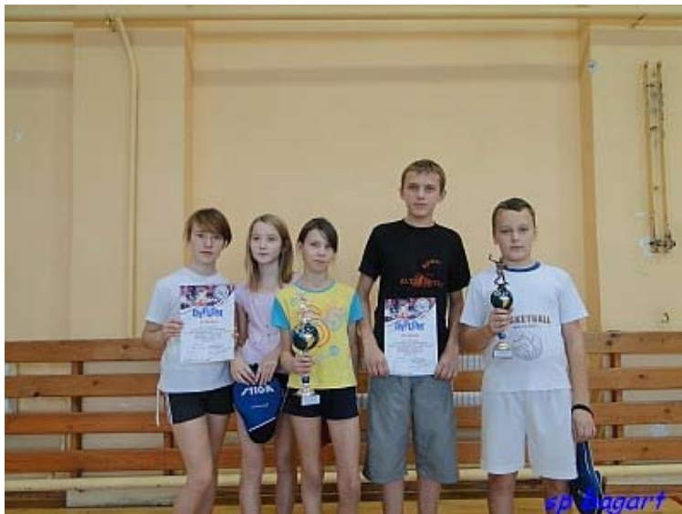
Nasi najlepsi w półfinale wojewódzkim tenisa stołowego.