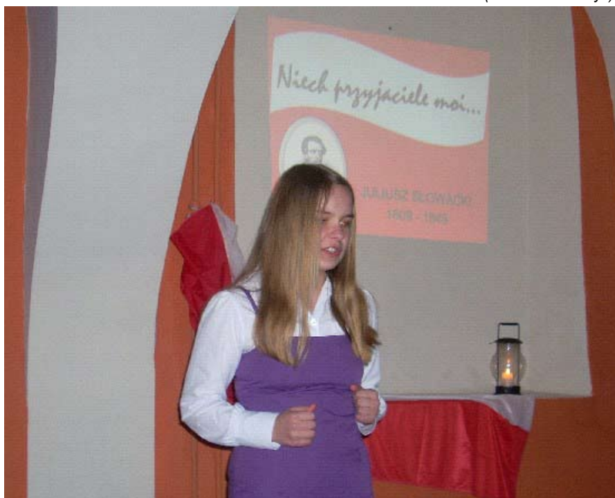
Laureatki 1. miejsca w trakcie interpretacji utworów Juliusza Słowackiego.