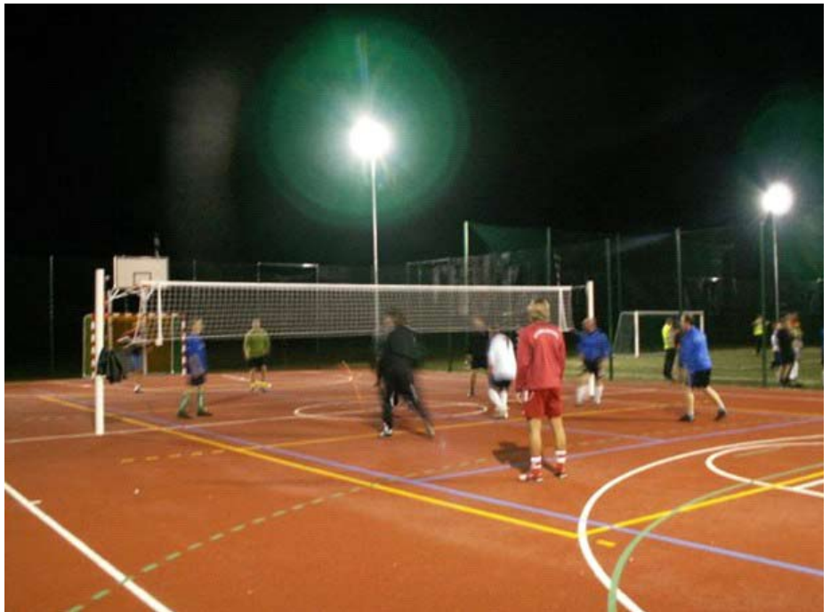
Dorośli okupują obiekt nawet późnym wieczorem

Redakcja: Staramy się udowodnić tezę, że Orlik zmienił w pewien sposób życie miesz-