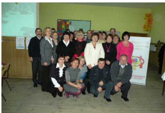
Uczestnicy projektu „45+” wraz z organizatorami – Bukowo.