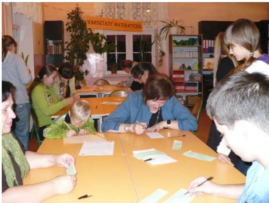
Uczestnicy warsztatów matematycznych.