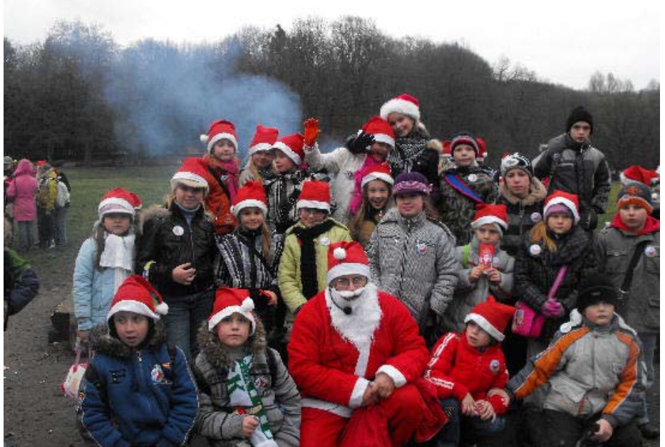
Upragnione spotkanie z Mikołajem.